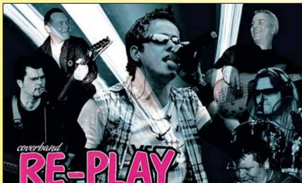
Die Coverband RE-PLAY wird Sonntag von 17 Uhr an auf der EWA-Schulbühne auftreten und versuchen, das Publikum in Hochstimmung zu bringen.

In den Jahren 2000 bis 2004 hat dann der Festausschuss der Arbeitsgemeinschaft der Ronnenberger Vereine und Verbände das Stadtfest organisiert. Von Jahr zu Jahr wurde es geschafft, das Stadtfest Ronnenberg auszubauen. Aus einer Bühne wurden schnell zwei Bühnen, aus einem Tag dann schnell zwei Tage. Durch die Vergrößerung des Stadtfestes Ronnenberg ist natürlich auch das Budget immer weiter angestiegen. Die Veranstaltung bewegt sich in Größenordnungen von mehr als 45 000 Euro für beide Veranstaltungstage. Aufgrund des immer größer werdenden Risikos hat die Arbeitsgemein-