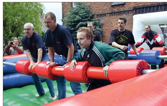
Ein weiteres Highlight war in diesem Jahr die XXXL-Soccer-Stadtmeisterschaft.