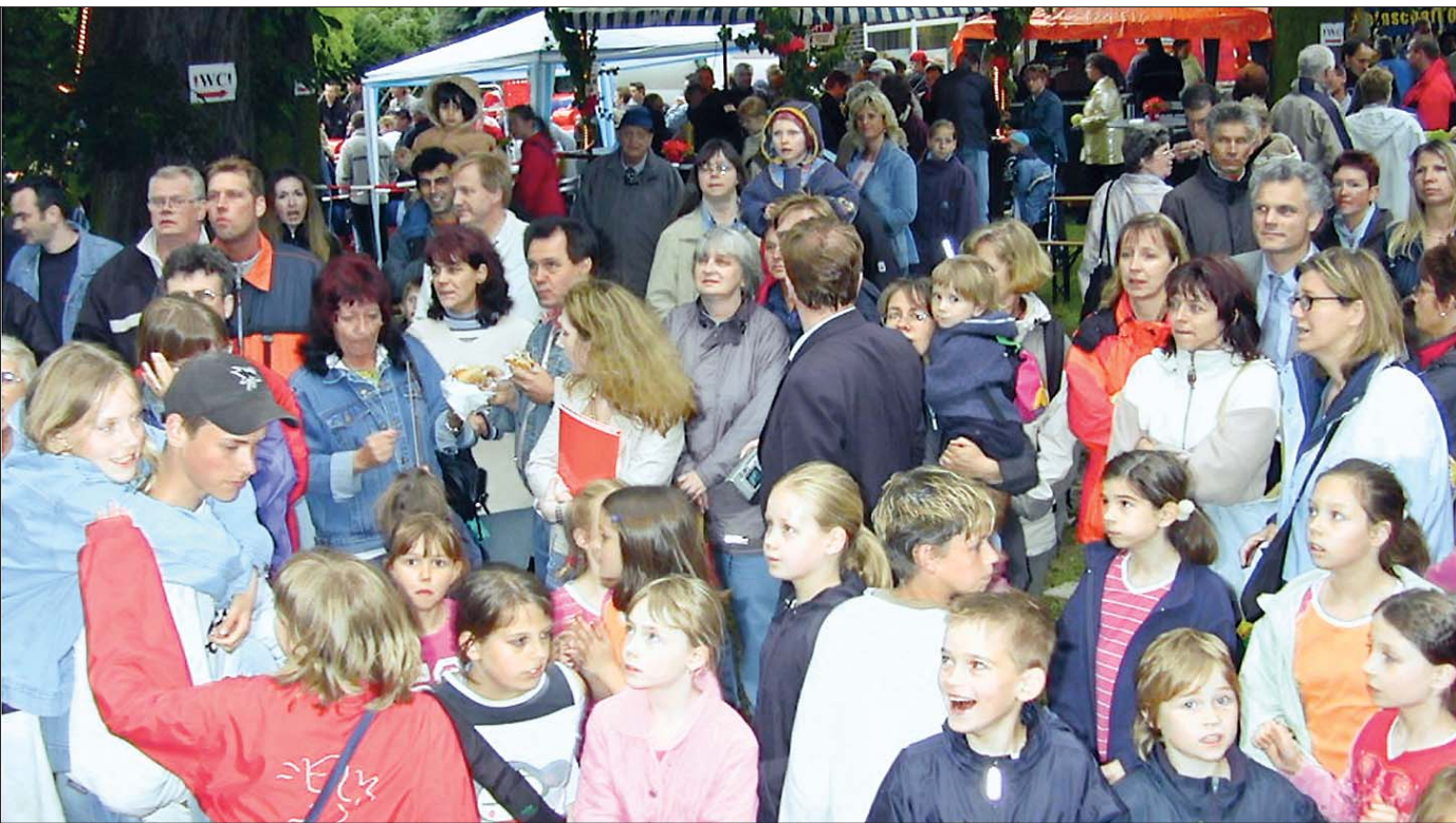
Schon am frühen Freitagabend drängten sich viele Besucher rund um die Kirche.

Rund um die Michaeliskirche / Feuerwehr erhält Spende