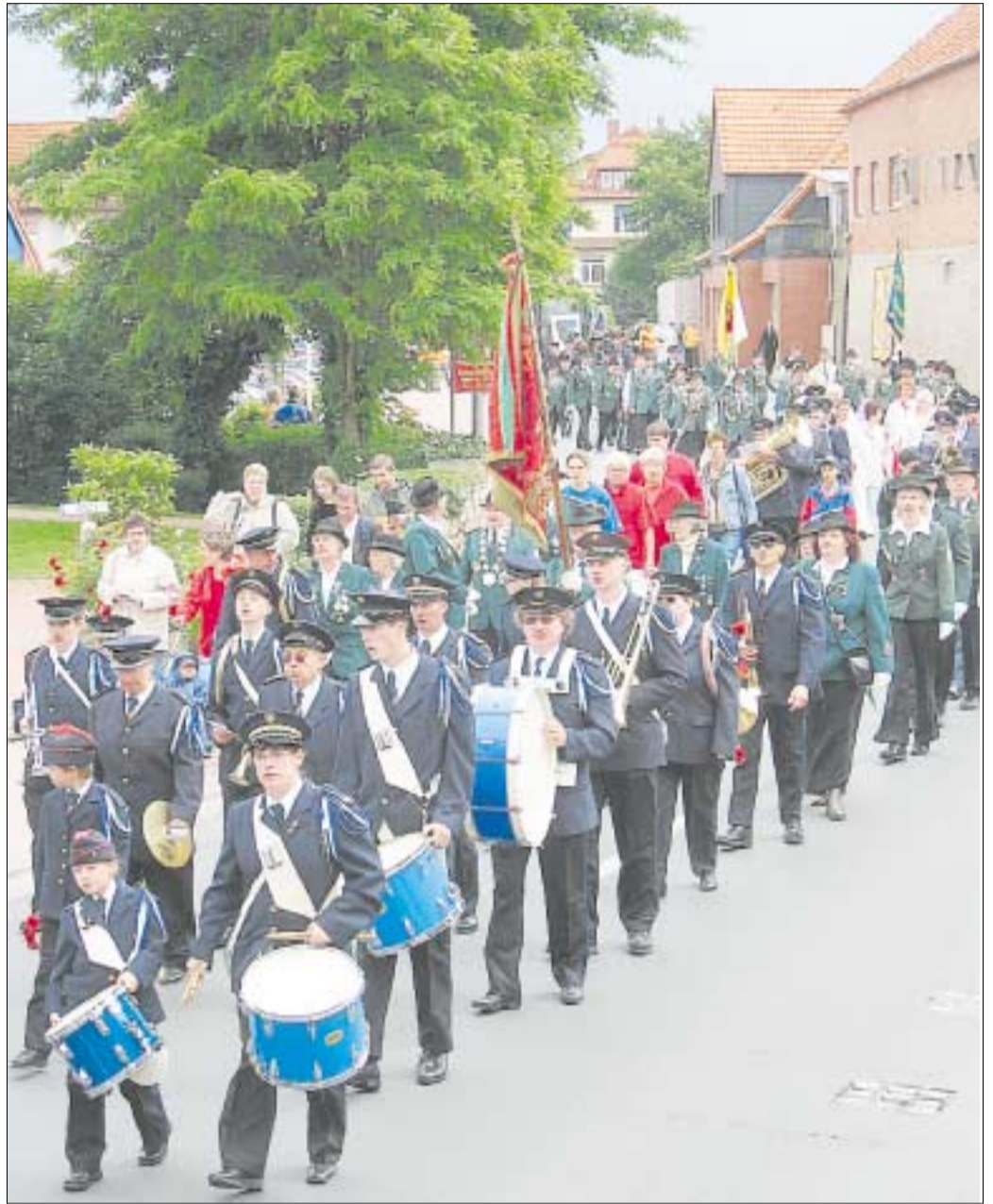
Die sieben Stadtteile präsentierten sich Sonnabend beim Ausmarsch durch Ronnenberg.

„Das Stadtfest in Barsinghausen ist die Nummer eins“, räumte Eicke ein und kündigt an: „Wir wollen die Nummer zwei werden.“