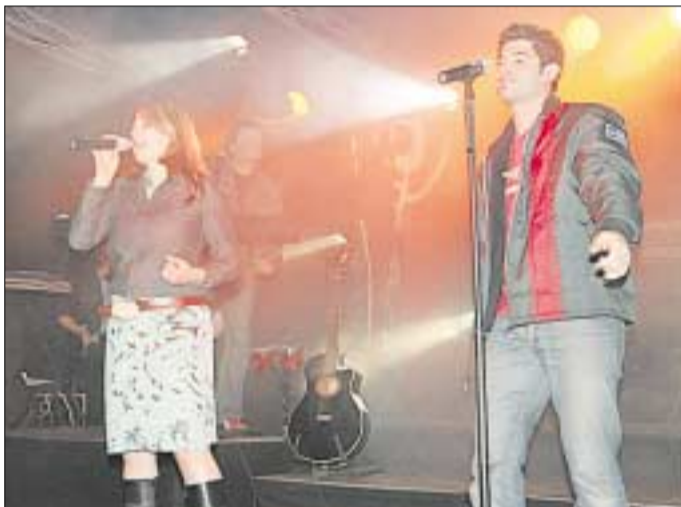
Die Band Steam sorgte am Freitag für den Höhepunkt des Festes. Viele Fans aus der Region waren extra nach Ronnenberg gereist.