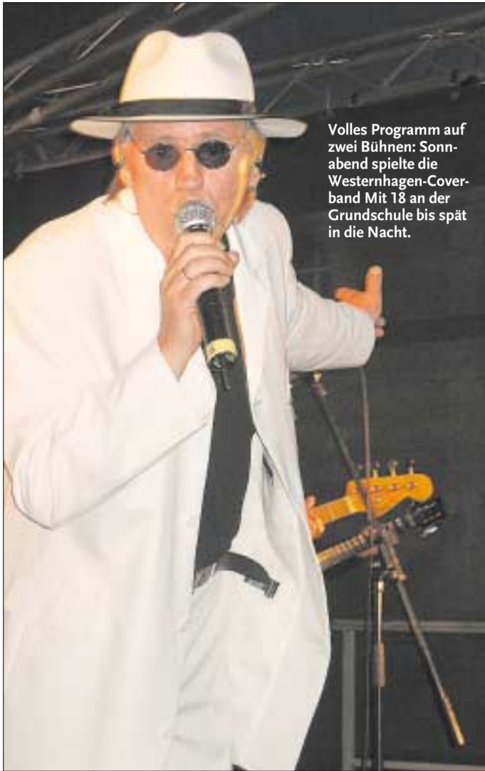
Volles Programm auf zwei Bühnen: Sonnabend spielte die Westernhagen-Coverband Mit 18 an der Grundschule bis spät in die Nacht.